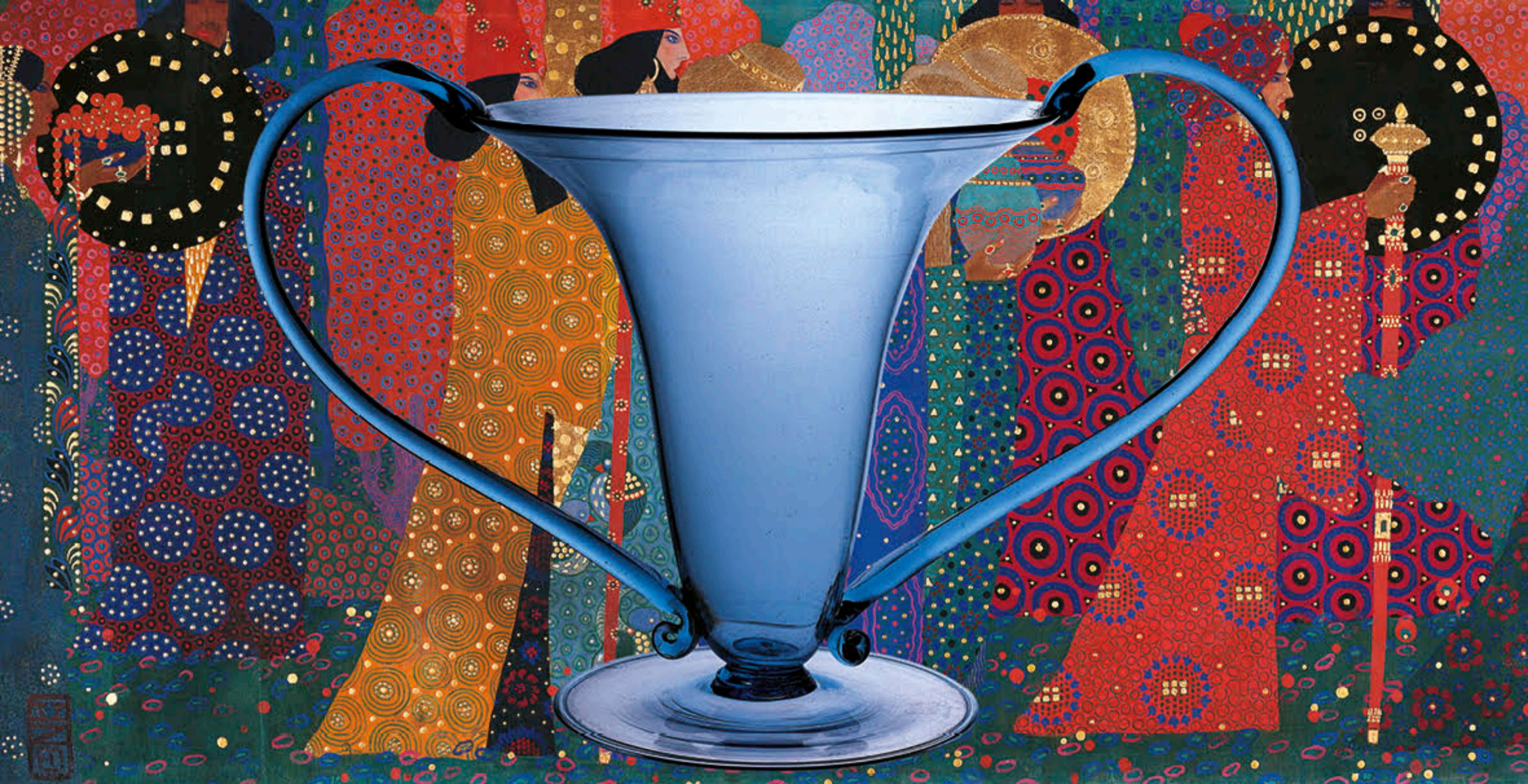
V. Zecchin, Pannello de "Le mille e una notte", 1914 ca., Musée d'Orsay V. Zecchin per Cappellin Venini e c., vaso "Libellula", 1921-22, collezione privata