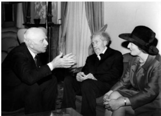
Vittorio Cini con Ezra Pound