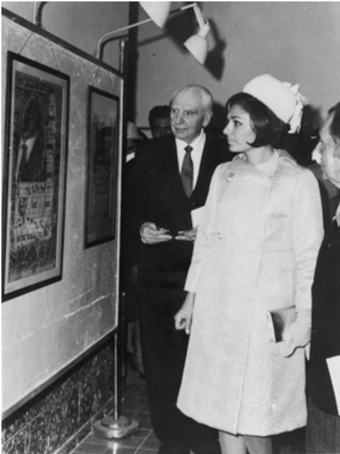
Vittorio Cini con Farah Diba

politica e militare della guerra, tanto da sorprendere Mussolini, che in una riunione si disse «grato della chiara ed esplicita esposizione che solo oggi 10 marzo 1943 è rappresentata nella sua piena realtà». Ma il culmine venne raggiunto nella seduta del Consiglio dei ministri del 19 giugno, quando Cini espose l'insostenibilità della situazione, anticipando in qualche modo la successiva presa di posizione del Gran Consiglio del fascismo del 24-25 luglio.