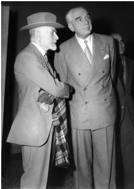
Bernard Berenson e Vittorio Cini

collegati, come la cantieristica e la navigazione interna. Il culmine sarebbe stato raggiunto nel 1932, quando la Compagnia adriatica di navigazione (con sede a Venezia), sorta dalla fusione di sei società di navigazione, sotto la sua presidenza assunse praticamente il controllo dei transiti nell'Adriatico e, attraverso questo, nel Mediterraneo orientale e nell'oriente in unione con altre società di navigazione collegate, sino alla costituzione, nel 1938, a Fiume, della Società Italiana di Armamento Sidarma.