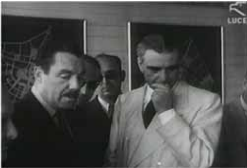
Vittorio Cini commissario per l'E42 (EUR)

vivace polemica sul modo di intendere il ruolo e la funzione dello Stato nell'economia.