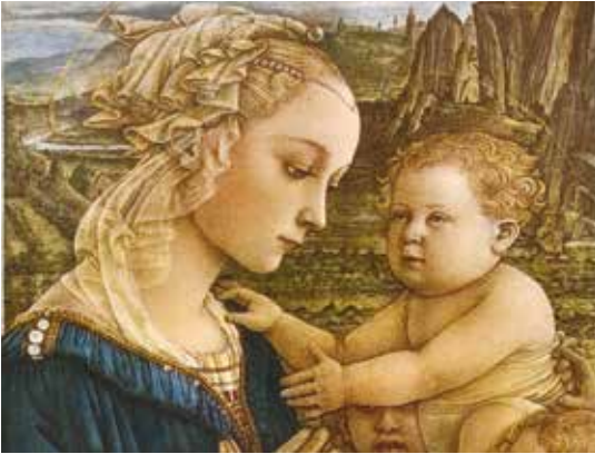
Filippo Lippi, Madonna con Bambino .

La Galleria di Palazzo Cini è aperta al pubblico grazie al sostegno di Assicurazioni Generali.