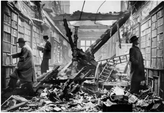
La Holland House Library di Londra dopo il bombardamento aereo del 1940.

a Venezia, per approfondire questioni cruciali riguardanti l'organizzazione della conoscenza nel presente, nel passato e nel futuro. La discussione si concentrerà su alcuni ambiti in cui tali tensioni si sono manifestate e continueranno a manifestarsi: la biblioteca, l'archivio di storia dell'arte e le tecniche della filologia. In tempi di crisi, le interconnessioni tra il contenuto della conoscenza e i modi in cui essa viene prodotta e organizzata sono sottoposte a un'indagine accurata e a una pressione senza precedenti. Diagnosi e prognosi delle crisi attuali sono messe ampiamente in discussione. Alcuni affermano che forme di conoscenza innovative e sperimentali sono ostacolate come non mai dall'insistenza rigida e ostinata sulla specializzazione disciplinare, altri sostengono che la formazione e la competenza disciplinari sono seriamente minacciate dal nozionismo approssimativo insito nell'interdisciplinarietà e nel populismo para-academico.