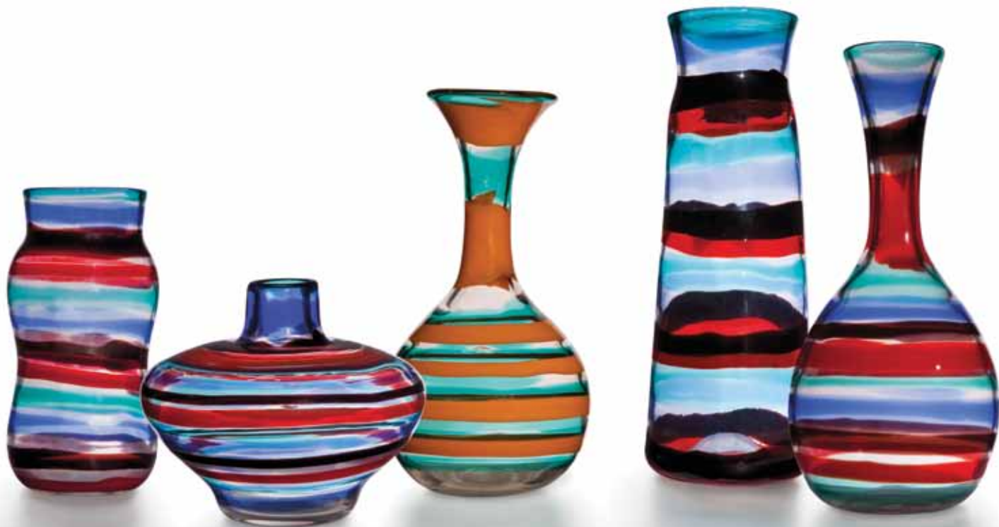
Fulvio Bianconi, Vasi a fasce orizzontali, 1953 ca.