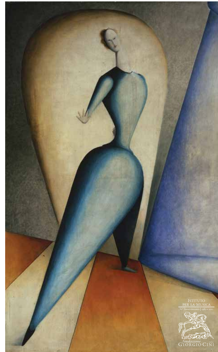
Oskar Schlemmer, Tänzerin (Die Geste) , 1922-23. Pinakothek der Moderne, München. München

Fondazione Giorgio Cini Istituto per la Musica +39 041 2710220 musica@cini.it | www.cini.it