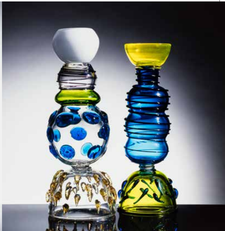
Ettore Sottsass, Sol e Sirio , 1982 e Alioth e Alcor , 1983, edizione Memphis Srl © Ettore Sottsass by SIAE 2017