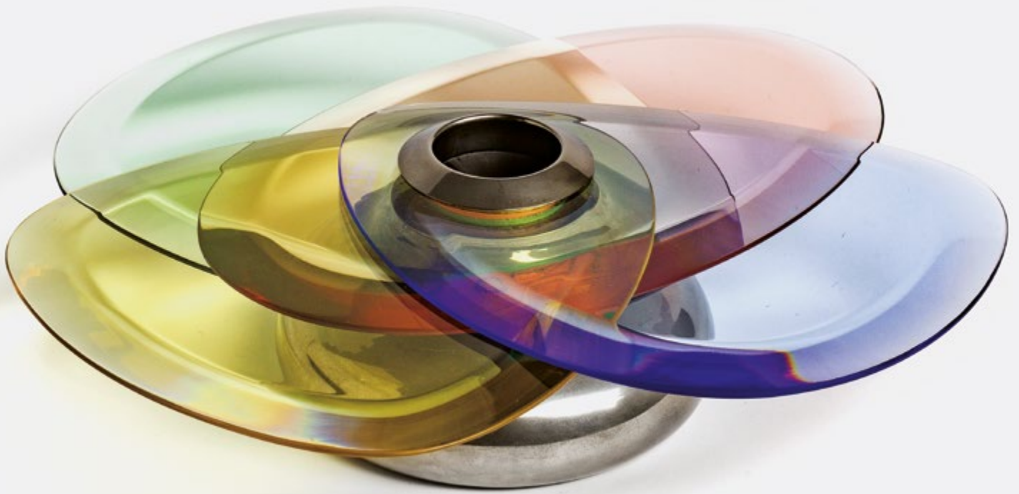
Max Ingrand, Vaso fiore , lastre di cristallo colorato e ottone nichelato, 1954, Galleria Michela Cattai