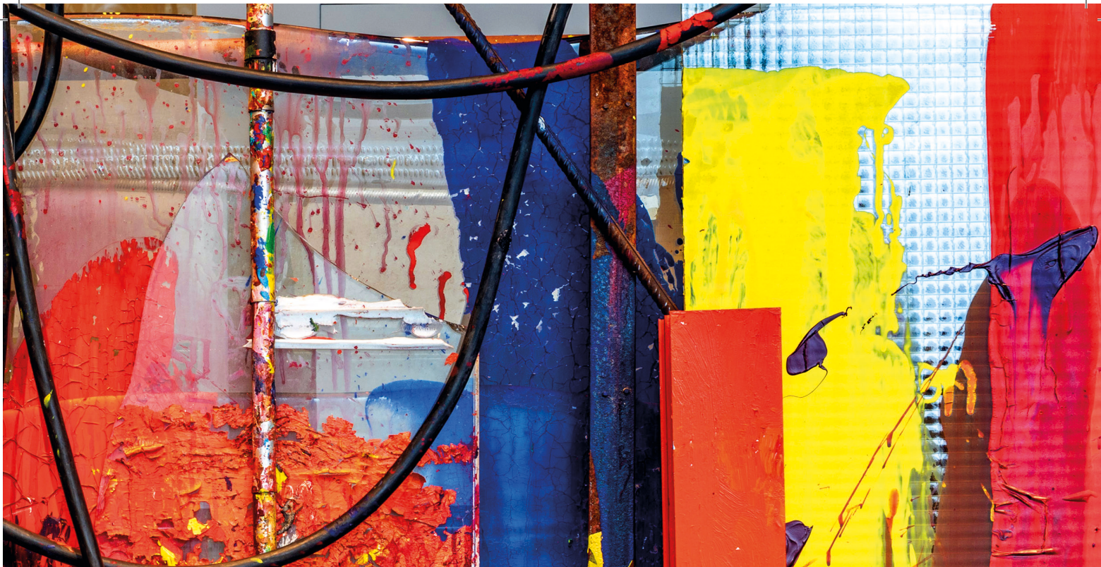
Vladimir Kopecký, Desiderio , dettaglio dell'opera, tecnica mista, collezione privata Venezia, 2021