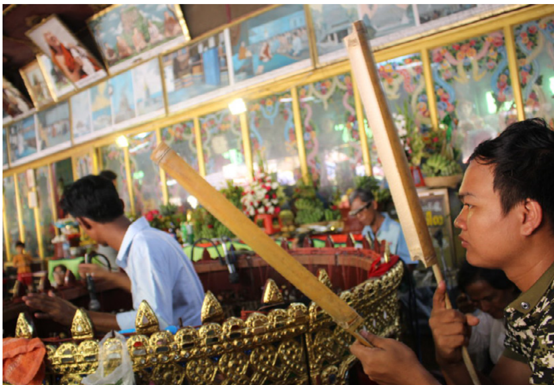
Fig. 2.3. Il walethkout , un idiofono ricavato una canna di bambù, a volte usato in sostituzione della barra di legno wa . Kyi Lin Bo ensemble, Villaggio di Popa, 2017.