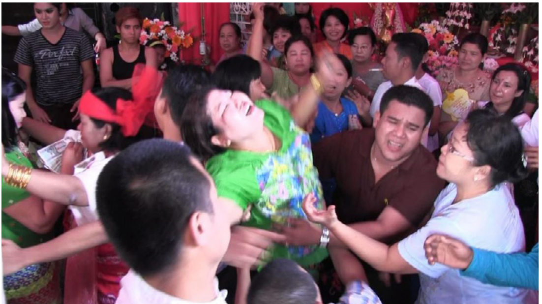
Fig. 1.3. Danza dei devoti durante una cerimonia. La possessione improvvisa di una delle devote richiama immediatamente l'attenzione degli altri partecipanti, che accorrono per sostenerla. Yangon, 2013.