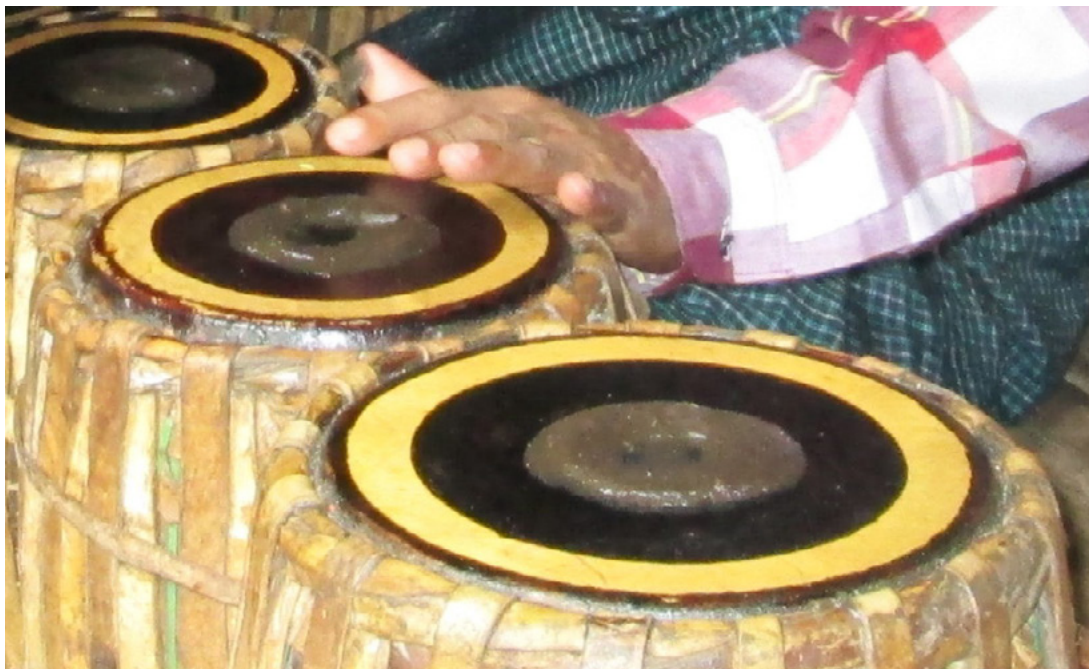
Fig. 2.1. Dettaglio della pasta pat sa , applicata sulla pelle superiore di un tamburo per ottenere l'intonazione corretta. Yangon 2013.

Nell'ensemble hsaing waing , metro, ritmo e melodia diventano un tutt'uno. Gli idiofoni guidano l'esecuzione di tutto l'ensemble, fornendo agli altri musicisti importanti punti di riferimento musicali. Oboe e cerchio di gong sviluppano le complesse e intricate melodie, in alcuni casi accompagnati dal cerchio di tamburi. Nel caso del nat hsaing , i tamburi, con il loro suono forte e pronunciato, forniscono l'energia necessaria al supporto delle danze di possessione dei/delle medium. Trattandosi di percussioni intonate, sebbene la loro azione rimanga principalmente ritmica, essa non è mai completamente slegata da una logica melodica.