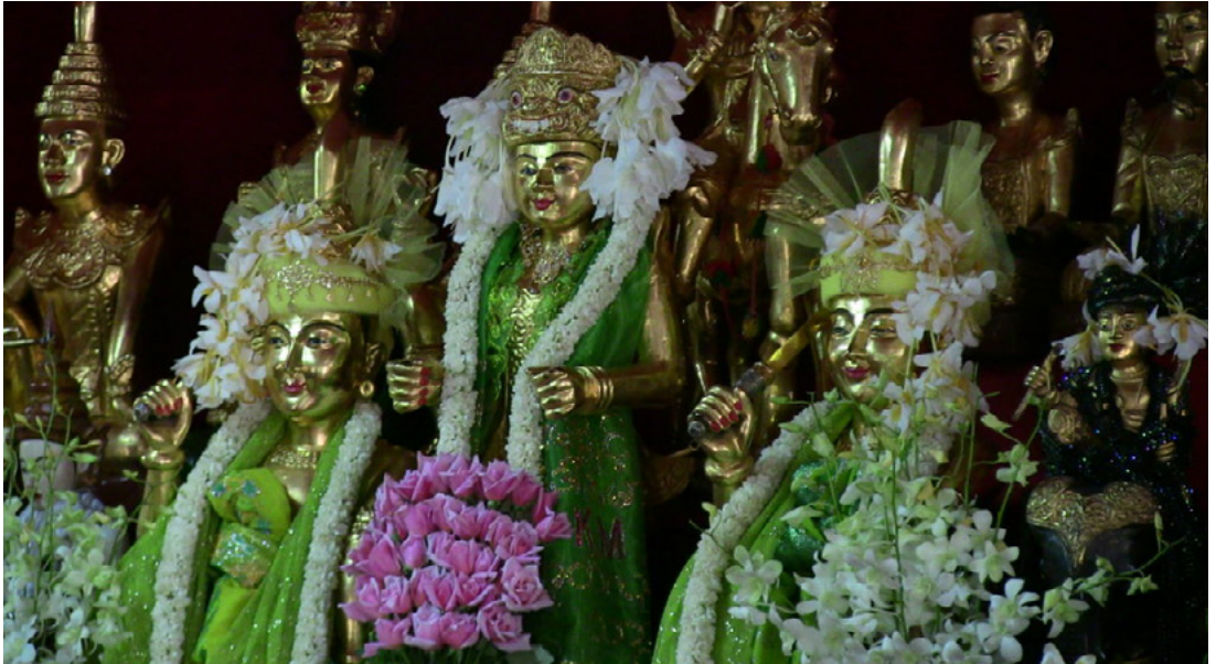
Fig. 1.5. Dettaglio di un altare privato del nat kadaw U Win Hlaing, a Yangon. I due fratelli di Taungbyone, Min Gyi e Min Lay, impugnano una spada, seduti al fianco della loro madre, Popa Medaw. Yangon, 2013.

La leggenda dei due fratelli di Taungbyone è molto complessa, e presenta diversi episodi. I due fratelli nascono dall'unione di U Byatta (di origine indiana e praticante musulmano), un messaggero del re, con May Wunna, un'orchessa mangiafiore che risiedeva sul monte Popa. I due fratelli crescono al servizio di re Anawratha di Bagan (XI secolo), primo grande re Birmano e promotore della religione Buddhista. Accumulando esperienza come guerrieri e dotati di poteri magici, la leggenda vuole che siano stati giustiziati da re Anawratha per aver disobbedito per un suo ordine diretto: i due non avrebbero infatti contribuito alla costruzione della pagoda buddhista voluta dal monarca nei pressi di Taungbyone, e ancora oggi sarebbe possibile notare due mattoncini mancanti nella struttura della pagoda del villaggio. Dopo la loro esecuzione, i due fratelli sarebbero diventati dei nat . Il re, pur di evitare la collera dei due potenti spiriti, istituì dunque il loro culto, facendoli insediare nel palazzo di Taungbyone e dando loro autorità sulla regione circostante.