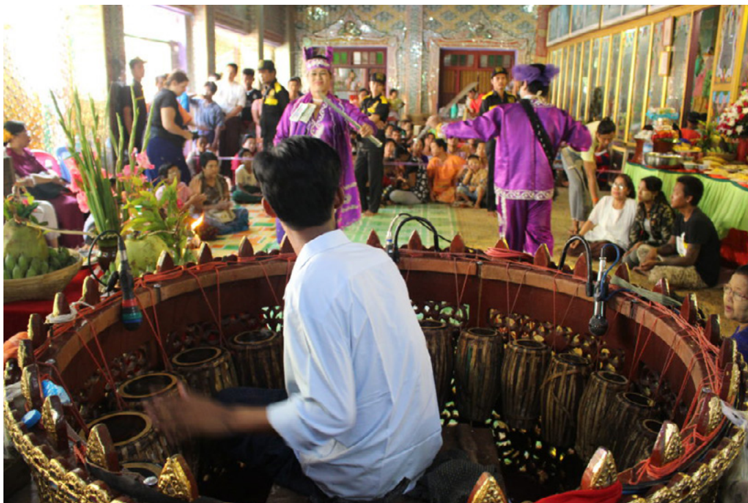
Fig. 2.5. Posto al centro dell'ensemble, il cerchio di tamburi pat waing svolge il ruolo di guidare il resto dei musicisti durante la performance di musiche e danze. Kyi Lin Bo ensemble, Villaggio di Popa, 2017.

Le pelli, intonate con la giusta quantità di pat sa , vengono percosse con il palmo delle mani o, nel caso dei tamburi di dimensioni più ridotte, con le dita. Per suonare, il musicista arriva a ruotare il busto di 180°.