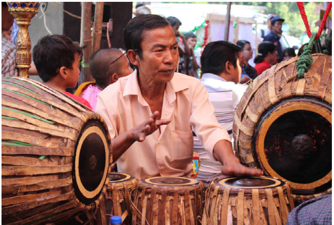
Fig. 2.6. Un musicista suona il gruppo di tamburi intonati formato dal sahkunt (a sinistra), i sei tamburi chauk lon pat (al centro) e il grande tamburo sospeso pat ma (a destra). Kyi Lin Bo ensemble, Yangon, 2017.

Il pat ma e il chauk lon pat costituiscono un gruppo di tamburi intonati suonati da un solo musicista (in alcuni casi, in questo gruppo è incluso un terzo tamburo corto, chiamato sahkunt ) (Fig. 2.6).