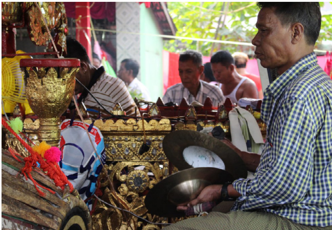
Fig. 2.4. I grandi cimbali linkwin donano all'esecuzione dell'ensemble un suono particolarmente intenso. Yangon, 2017.