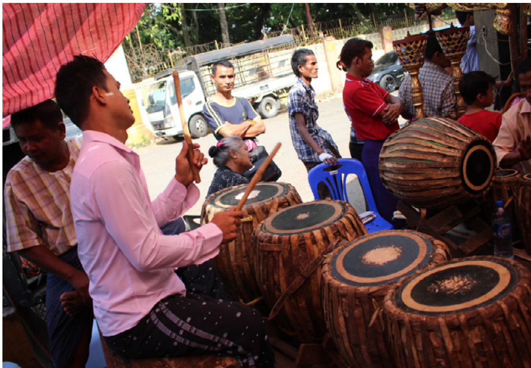
Fig. 2.7. Un musicista suona i grandi tamburi sito , percuotendo le pelli con delle bacchette. Kyi Lin Bo ensemble, Yangon, 2017.

A differenza degli altri tamburi dell'ensemble, le pelli dei tamburi sito non vengono intonate: l'ottenimento di un suono più grave o più acuto dipende esclusivamente dalla grandezza del corpo del tamburo. Per questo motivo, il sito svolge un ruolo esclusivamente di supporto e rinforzo ritmico, spesso in corrispondenza dei tempi marcati dagli idiofoni si e wa , e dunque del tamburo pat ma . In genere, il tamburo più grave suona in corrispondenza del tempo primario marcato dal wa , alla fine di un ciclo metrico-ritmico.