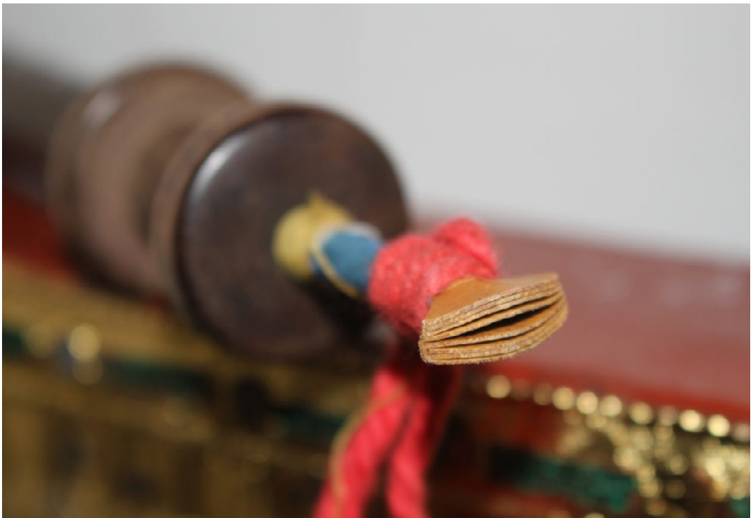
Fig. 2.11. Dettaglio dell'ancia multipla dell'oboe hne .