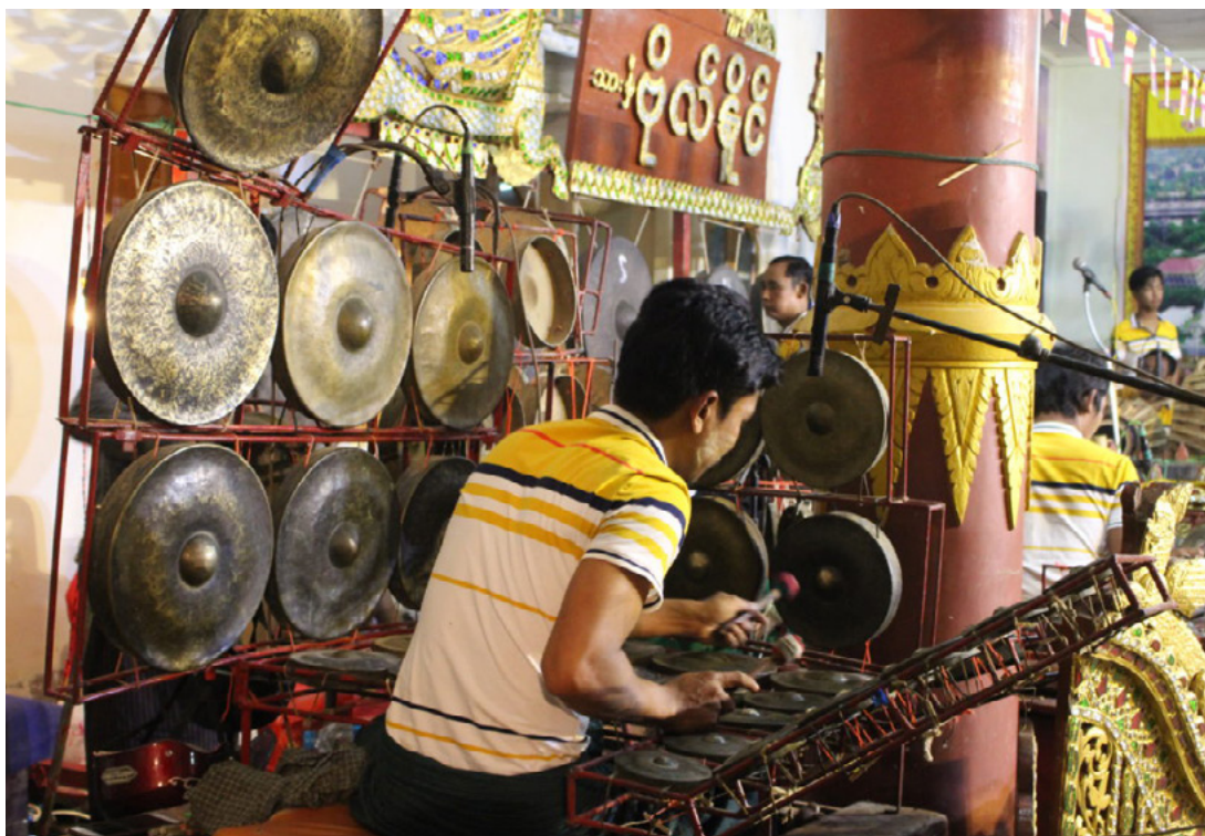
Fig. 2.9. Il carillon di gong maung hsaing fornisce supporto melodico al cerchio di gong; come quest'ultimo, viene suonato utilizzando dei martelletti. Bo Naing ensemble, Mandalay, 2018.

Lo strumento non viene sempre inserito nell'organico dell'ensemble. Gli ensemble nat hsaing , in particolare, fanno spesso a meno di questo strumento, che svolge perlopiù un ruolo di supporto del cerchio di gong kyi waing . Solitamente, infatti, il maung hsaing replica l'elaborazione melodica del cerchio di gong, con delle minime variazioni.