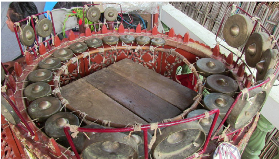
Fig. 2.8. Il cerchio di gong kyi waing . I gong sospesi verticalmente rappresentano un'innovazione relativamente recente, e permettono al musicista di eseguire maggiori variazioni melodiche. Villaggio di Taungbyone, 2013.

Il kyi waing ( kyi , 'bronzo' e waing , 'circolare') consiste in un cerchio di ventuno gong bombati e intonati e disposti circolarmente. Ogni gong rimane sospeso grazie a dei lacci che si inseriscono in appositi fori e per poi venire assicurati ad un telaio. Il telaio di legno su cui sono fissati i lacci è a volte decorato in maniera analoga a quella del cerchio di tamburi, con vernici; in altri casi, consiste in una semplice struttura in ferro. Il musicista siede al centro del telaio circolare, percuotendo i diversi gong con dei martelletti dall'impugnatura in legno, dotati di una parte morbida all'estremità, con la quale si colpisce la bombatura. Come nel caso del cerchio di tamburi, nel corso della performance il musicista ruota il proprio busto fino a quasi 180°, riuscendo così a raggiungere tutti i gong. Contrariamente ai tamburi dell'ensemble, il cerchio di gong kyi waing è uno strumento ad intonazione fissa. Per questo motivo, viene oggi usato come riferimento per l'accordatura dei tamburi ad intonazione mobile, che vengono regolati prima di ogni esecuzione.