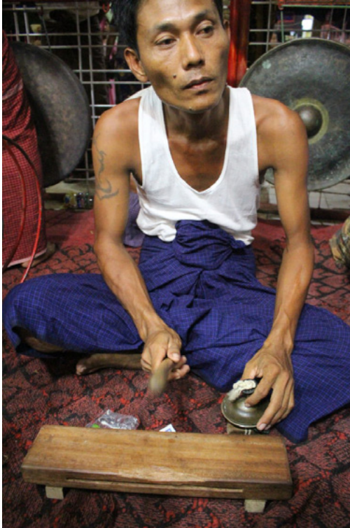
Fig. 2.2. Un musicista suona gli idiofoni si (piccoli cimbali) e wa (barra di legno). Villaggio di Taungbyone 2018.

Il si è costituito da due piccoli cimbali: il cimbalo inferiore è spesso fissato ad una tavoletta di legno, così che il musicista possa suonare lo strumento con una mano sola. Con l'altra mano, il musicista suona il wa : questo è costituito da una bacchetta di bambù, utilizzata per percuotere una barra di legno forata. Il wa viene occasionalmente sostituito dal walethkout : questo viene realizzato tagliando longitudinalmente una canna di bambù per quasi tutta la sua lunghezza, circa un metro (Fig. 2.3). Il musicista impugna lo strumento con entrambe le mani, facendo percuotere tra loro la due parti dello strumento. Spesso, nella parte corrispondente all'impugnatura, vengono applicati degli elastici, che permettono l'utilizzo dello strumento anche con una mano sola, anche se con minore precisione. Il suono del walethkout è particolarmente intenso, e ben si adatta all'accompagnamento delle danze.