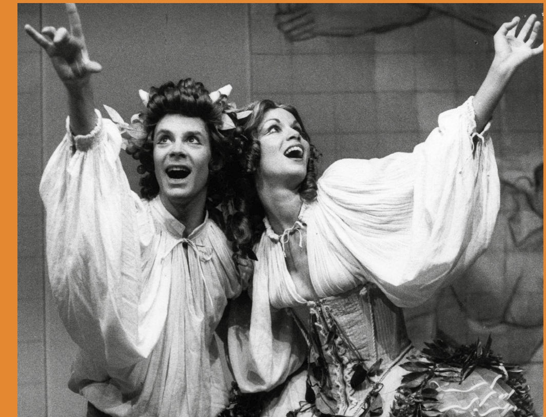
Lucia e Paolo Poli in Apocalisse!, 1973

L'attrice Lucia Poli e l'attore e regista Arturo Brachetti, in dialogo con la giornalista Anna Bandettini, incontrano il pubblico per rievocare la poliedrica figura di Paolo Poli. Ricordi, testimonianze e immagini di un passato d'arte che tornerà vivo grazie alla presenza dei due artisti ospiti e delle loro storie di spettacolo.