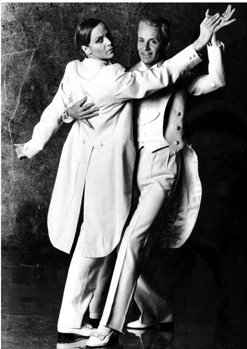
Lucia e Paolo Poli in Cane e gatto , 1985

L'Istituto per il Teatro e il Melodramma della Fondazione Giorgio Cini, in collaborazione con l'Università Ca' Foscari di Venezia e l'Università degli Studi di Firenze, dedica un convegno di studi a Paolo Poli (Firenze, 1929 – Roma, 2016) nel decennale della sua scomparsa. Fiorentino di nascita, si impone fin da subito all'attenzione del pubblico come artista prolifico e originale e costruisce una lunga e brillante carriera, calcando il palcoscenico ben oltre gli ottant'anni. Autore di un teatro irripetibile, leggero ma colto, elegante e irriverente, Poli, grazie alla sua inesauribile fantasia, è stato un indiscusso protagonista della scena teatrale italiana del secondo Novecento e uno straordinario esempio di longeva creatività. L'Istituto per il Teatro, in quanto ente conservatore dell'archivio personale di Paolo Poli, ha messo a disposizione degli studiosi molti e preziosi documenti custoditi, al fine di approfondire aspetti inediti di questa straordinaria pagina del teatro italiano.